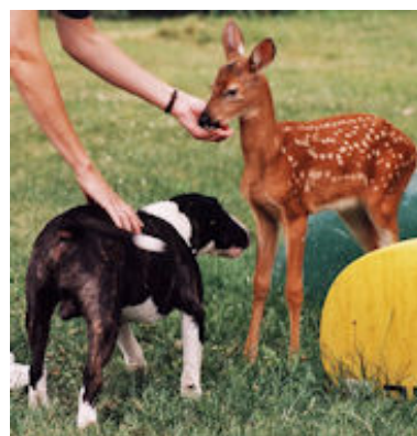
Miniature Bull Terrier Jemmy Hilser forsigtigt på Bambi