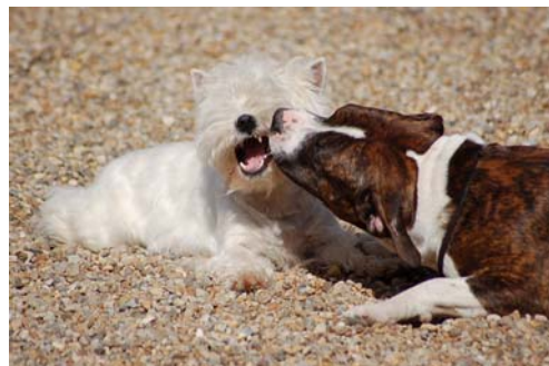
American Staffordshire Terrier Dio I leg med West Highland White Terrier

American Staffordshire Terriers har primo 2005 indført at for at kunne indgå i avl, skal alle American Staffordshire Terriers have en godkendt mentalbeskrivelse. Fra 2001-2008 er 218 American Staffordshire Terriers blevet mentalbeskrevet. Ud af disse blev 4 (1 i 2001 og 3 i 2006) ikke godkendt og blev dermed udelukket fra avl. Det giver en godkendelsesprocent på 98 ( se bilag | DTKs 4 bull racer ).