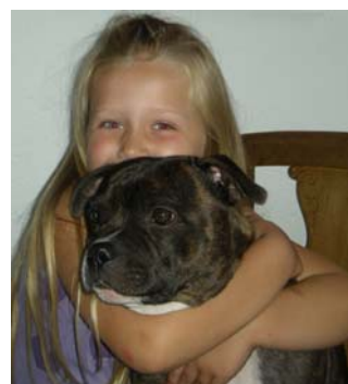
Staffordshire Bull Terrier Tafi The Nanny dog

Nedenstående skal begrænse den ulovlige import af ofte alt for unge uvaccinerede hvalpe og andet use-riøst opdræt af dårligt opfostrede hunde. Området giver også stort råderum for sort økonomi.