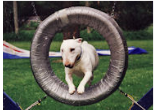
Miniature Bull Terrier Greg På agility banen

D.v.s. at under 20 % af de registrerede American Staffordshire Terriers har en stamtavle. De øvrige er altså blandingshunde. Hunde fra "alternative" klubber eller hunde, der bevidst er registreret som en anden race, end det rent faktisk drejer sig om.