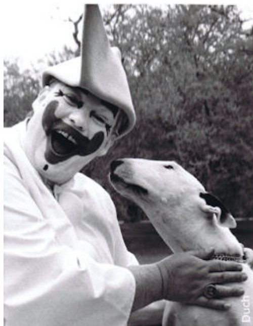
Bull Terrier Ami Med Bakkens Pjerrot som har optrådt med en Bull Terrier på Bakkens scene.

Mange af de hunde, der i medierne betegnes som kamp/muskelhunde, som forårsager disse problemer, er blandingshunde, illegale importører og/eller hunde, der ikke er registreret i Dansk Hunderegister. Det drejer sig i høj grad om dårligt opdrættede og dårligt opfostrede hunde, hvor sælger ikke prioriterer kritisk udvælgelse af nye ejere og rådgivning af disse samt ejere med utilstrækkelig kompetence.